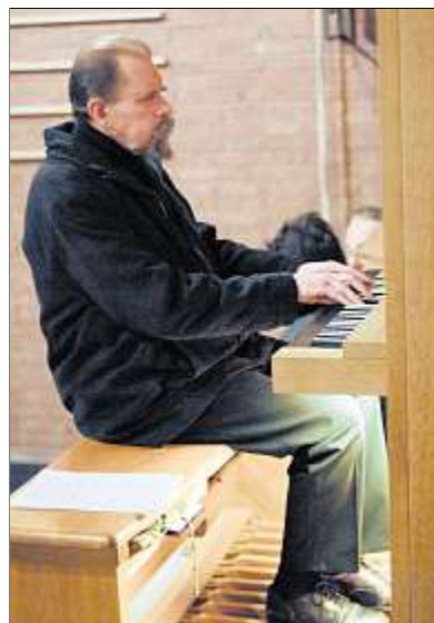
Organist Vladimir Plakidin.

So kommt es, dass der „25. Feilitzsch-Advent“ in der St.-Nepomuk-Kirche ganz im Zeichen österreichischer Volksmusiktraditionen steht. Menuett und Jodler, Boarische und immer wieder Tiroler Mundartlieder verflechten die vier Musikanten zu einer vielschichtigen Einheit.